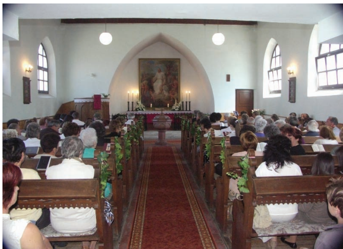
A hálaadásra készülő ünneplő gyülekezet

Hálaadó istentiszteletre hívogattak június 14-e napsütéses vasárnap délelőttjén a monori evangélikus templom harangjai. A Sándy Gyula tervei alapján a wittenbergi vártemplom mintájára készült templomot hetven évvel ezelőtt, 1939. június 18-án szentelte fel Raffay Sándor püspök – erre emlékezett a gyülekezet.