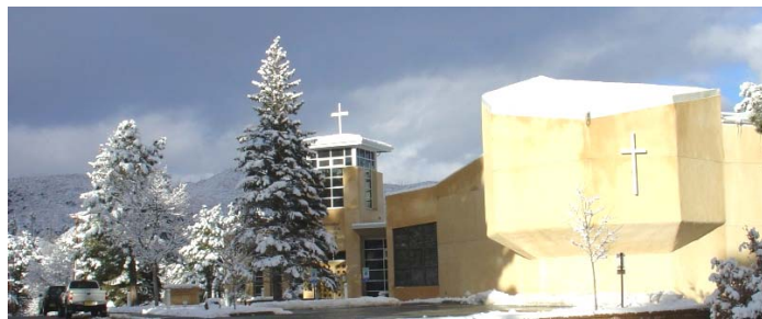
A Los Alamos-i Betlehem evangélikus gyülekezet 1952 és 1968 között épült temploma